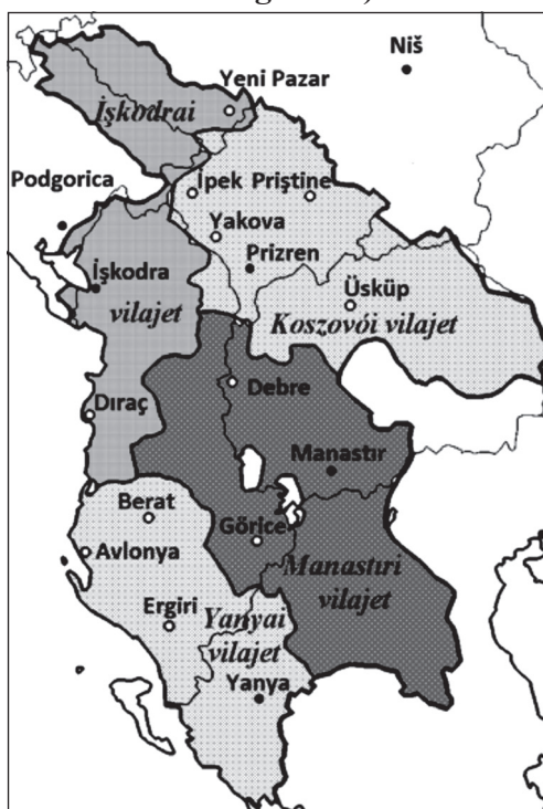
Map 1. The Albanian vilajets (Turkish names and present borders in background)