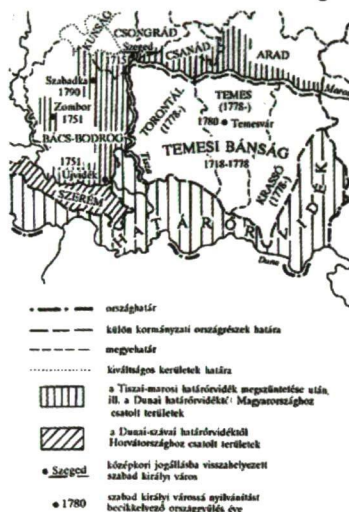
1. térkép. A Temesi Bánság és térsége területi struktúrájának alakulása Map 1. Territorial structure of Temes Bánság and its region

Forrás: Edelényi-Szabó D. 1928, Némethy A. 1958.