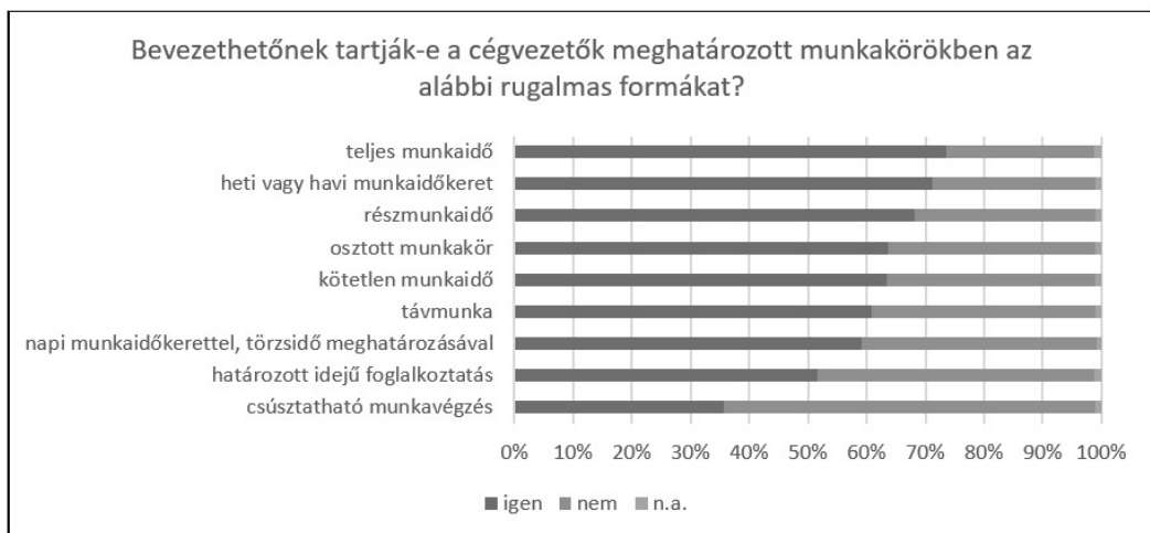
Diagram 2.: Do the managers consider the following flexible employment forms implementable in certain jobs?

(IFKA tanulmány alapján saját szerkesztés)