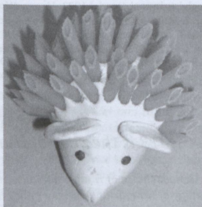
2. ábra Kézműves foglalkozások produktumai

A két legnépszerűbb kreatív feladat a bárány és a süni volt. Ismerték a technikát, kicsi és nagy is elkészíthette és gyors sikerélményhez juttathatta a gyermeket.