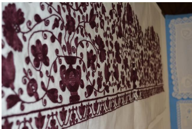
4. kép: A Felsőörsi Hímző Műhely díjazott tagjai Mezőkövesden, a Kisjankó Bori Országos Hímzőpályázaton 2019

2014-ben az általuk képviselt Balaton-felvidéki és Bakony-vidéki hímző kultúra elsőként került be a Veszprém Vármegyei Értéktárba. A hímzőkör tevékenysége azért is példaértékű és hiánypótló, mert az értékek átadásában, a hímzés megismertetésében és felelevenítésében mutatkozik meg.