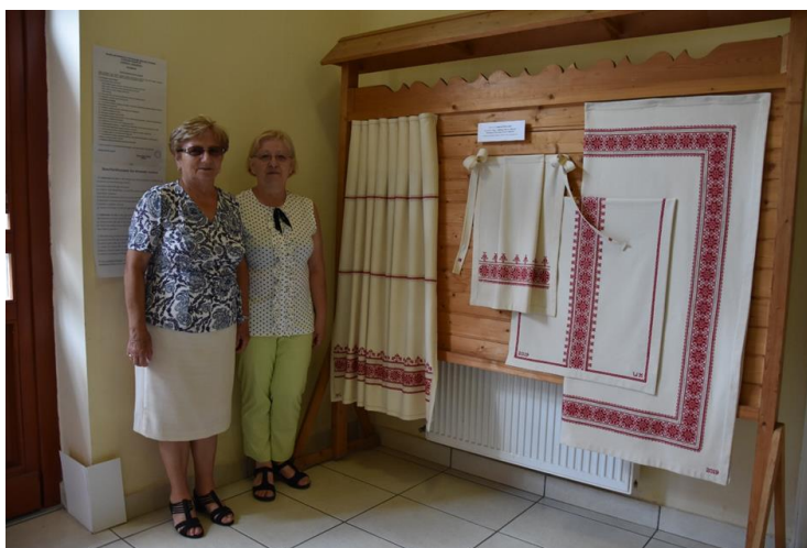
6. kép: A Tótvázsonyi Hímzőműhely tagjai Mezőkövesden, a Kisjankó Bori Országos Hímzőpályázaton 2019