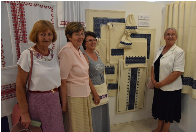
4. kép: A Felsőörsi Hímző Műhely díjazott tagjai Mezőkövesden, a Kisjankó Bori Országos Hímzőpályázaton 2019

Elkezdődött az alkotások zsűriztetése és a felkészülés az országos hímző pályázatokra. Számos rangos pályázaton díjakat nyertek, 2019 végén elnyerték a Népi Tárgyalkotó Iparművész Szervezet minősítést. Felkutatták a felsőörsi hagyományos fehér hímzést. Az alkotókör több alkalommal tartott mesterség bemutatót és kézműves foglalkozást a helyi iskolában, különböző települési programokon és kiállításokon mutatták be alkotásaikat.