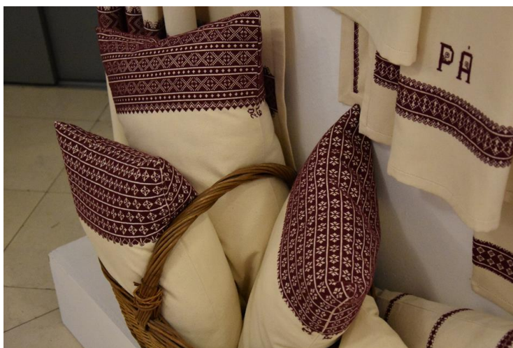
3. kép: A Zoboralji Örökségünk Őrzői díjnyertes munkái – Mezőkövesd, Kisjankó Bori Országos Hímzőpályázat 2019

Ez a közösség a magyarság és a felvidéki magyarság összetartozását erősíti. Egyrészt ott, a saját maguk közegében, másrészt az anyaországhoz való kötődésük is sokkal erőteljesebbé vált.