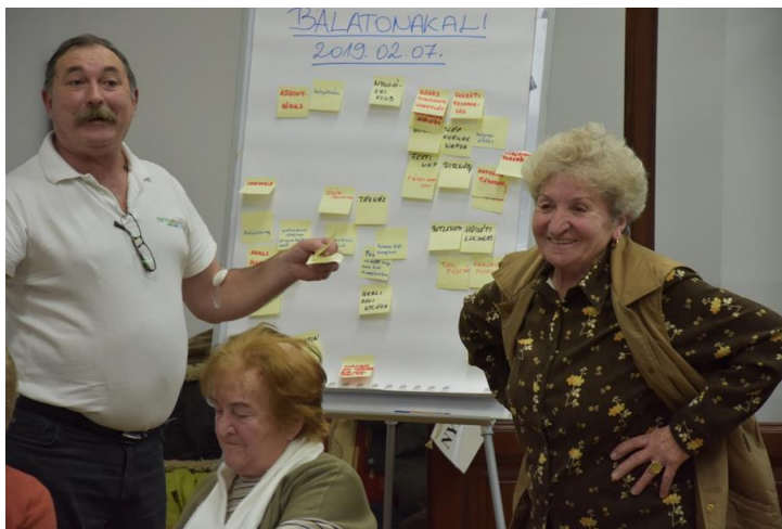
1. kép: Közösségi beszélgetés Balatonakaliban 2019