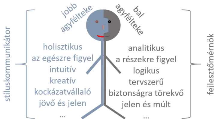
3. ábra: Egyén-i komplexitás

Mindez kiegészíthető még azzal, hogy a férfiak és nők eltérő kognitív stratégiákat alkalmaznak a feladatvégzés/problémamegoldás során. Nevezetesen, hogy a férfiak holisztikus, míg a nők szeriális megközelítést alkalmaznak (Vanderberg–Kuse, 1978; Roberts–Bell, 2000, 2003).