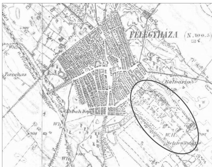
1. ábra: A III. katonai felmérés Kiskunfélegyházáról, a pirossal keretezett rész a Közelszőlő