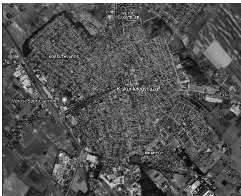
2. ábra: Google Earth felvétel Kiskunfélegyházáról napjainkban