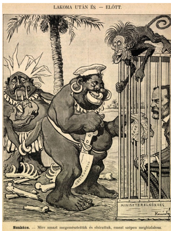
4. kép. Lakoma után és – előtt

Polónyit azonban nem csupán a fenti karikatúrán bújtatták kannibálbőrbe. Egy másik torz rajzon az emberevők, Polónyi és Kossuth már elfogyasztották Széllt, csak a volt kormányfő fejét tartja Kossuth a kezében. Polónyi száját nyalogatva levelekkel hizlalja fel az újabb áldozatot, Khuen-Héderváry miniszterelnököt, akit ketrecbe zártak, mozgásteret minimális a kép üzenete szerint. Polónyi gyilkos fegyvere, amellyel áldozataival végez, az „obstrukció” feliratú nagykés. 69