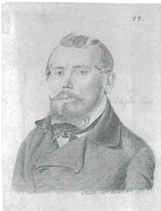
Berzsenyi Lénárd képe Hajdú Lajosról